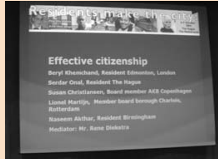
De Resident University richt zich ook op de professionals die voor overheid en andere organisaties (o.a. VROM, gemeenten, woningbouwcorporaties) aan de stad werken.

"Persoonlijk contact en investeren in vertrouwen"