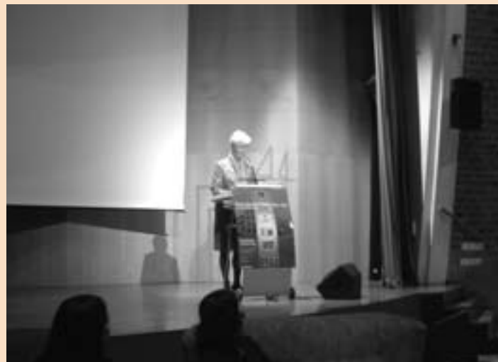
Sybilla Dekker, minister van Volkshuisvesting, Ruimtelijke Ordening en Milieu wil Europese richtlijnen om bewonersinitiatieven te stimuleren.

Sybilla Dekker, minister van Volkshuisvesting, Ruimtelijke Ordening en Milieu, gaf het startschot op de 'professionals'dag. De minister sprak de wens uit voor Europese richtlijnen voor het stimuleren van (bewoners)initiatieven die leiden tot prettige, schone en veilige steden. In Nederland dringt inmiddels ook steeds meer het besef door dat het in stedelijke vernieuwingstrajecten om meer gaat dan alleen stenen en structuren. Het gaat om mensen.